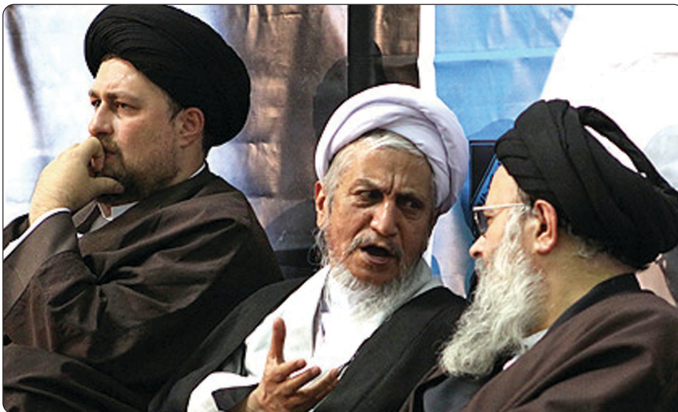
یادداشتی از حضرت آیت الله العظمی صانعی (مدظله العالی) پیرامون

شخصیت همسر حضرت امام خمینی (سلام الله علیه)